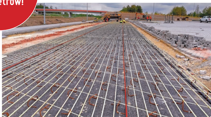
Czujniki EpsilonRebar w inteligentnej, betonowej autostradzie