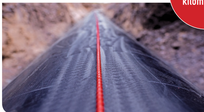
Instalacja czujnika EpsilonRebar w obrębie gazociągu