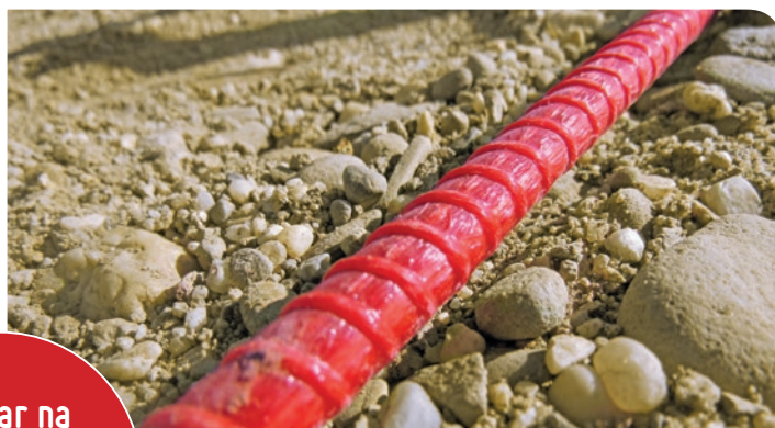
Nasyp drogowy z czujnikiem EpsilonRebar