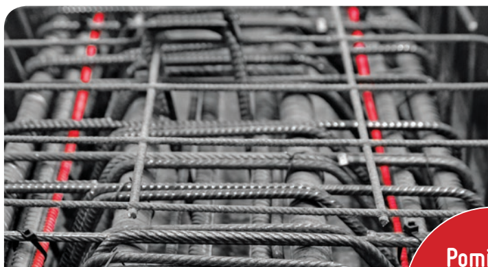
Belka sprężona betonowa z czujnikami EpsilonRebar