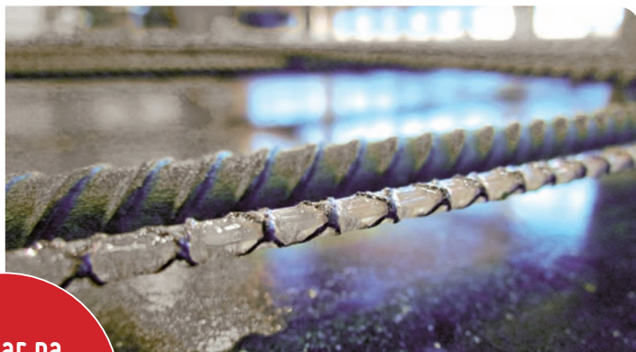
EpsilonSensor w stropie żelbetowym (konstrukcja płytowo-stupowa)