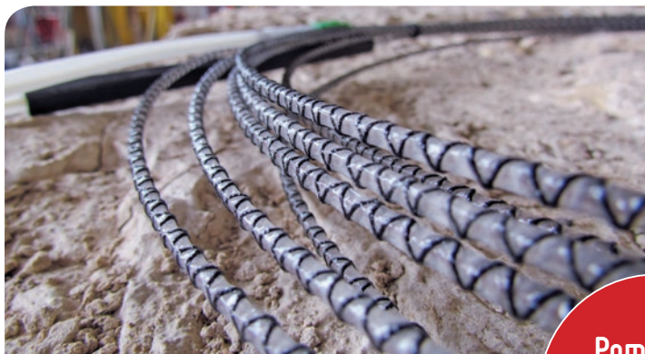
Widok czujnika EpsilonSensor przed zamontowaniem w próbce laboratoryjnej