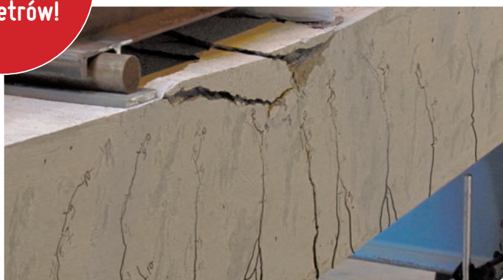
Pomiar ekstremalnie szerokich rys czujnikiem EpsilonSensor