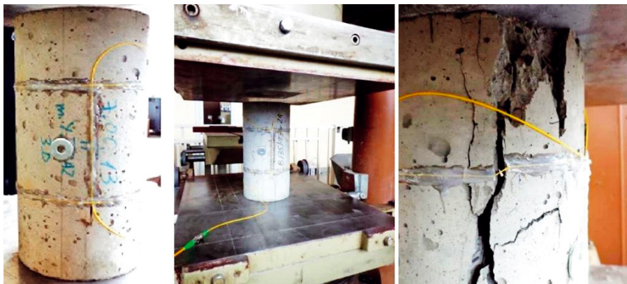
Rys. 2. Widok badanej próbki